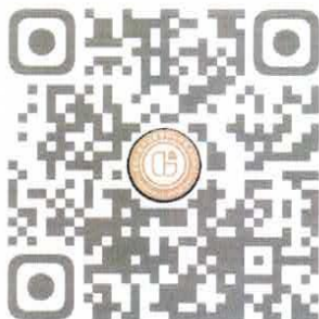
物业管理师报名资料包